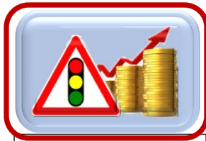
Knapp för projekt