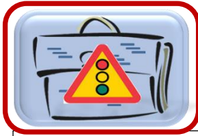
Knapp för portfölj